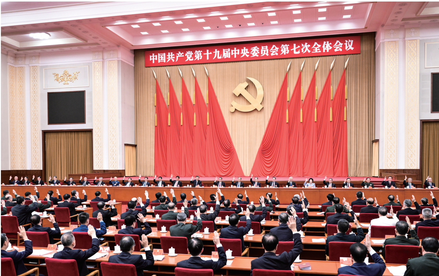
中国共产党第十九届中央委员会第七次全体会议,于2022年10月9日至12日在北京举行。中央政治局主持会议。

新华社北京10月12日电 中国共产党第十九届中央委员会第七次全体会议公报 (2022年10月12日中国共产党第十九届中央委员会第七次全体会议通过) 中国共产党第十九届中央委员会第七次全体会议,于2022年10月9日至12日在北京举行。 出席全会的有中央委员199人,候补中央委员159人。中央纪律检查委员会委员和有关负责同志列席会议。 全会由中央政治局主持。中央委员会总书记习近平作了重要讲话。 全会决定,中国共产党第二十次全国代表大会于2022年10月16日在北京召开。 全会听取和讨论了习近平受中央政治局委托作的工作报告。全会讨论并通过了党的十九届中央委员会向中国共产党第二十次全国代表大会的报告,讨论并通过了党的十九届中央纪律检查委员会向中国共产党第二十次全国代表大会的工