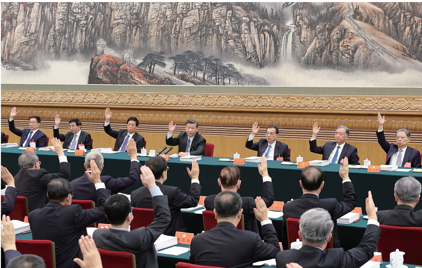
10月21日,中国共产党第二十次全国代表大会主席团在北京人民大会堂举行第三次会议。习近平、李克强、栗战书、汪洋、王沪宁、赵乐际、韩正等出席会议。