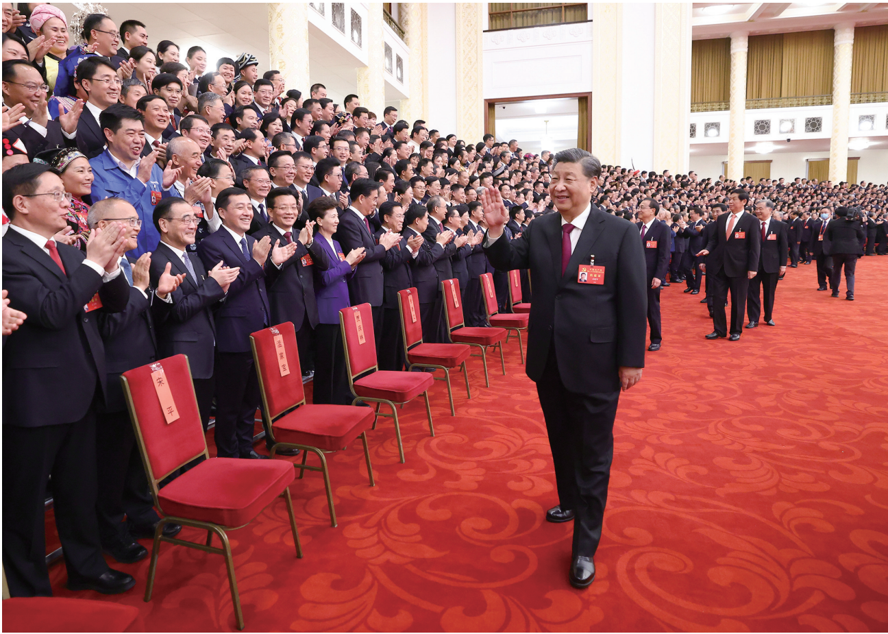
10月23日下午,中共中央总书记、国家主席、中央军委主席习近平等领导同志在北京人民大会堂亲切会见出席党的二十大代表、特邀代表和列席人员,并同大家合影留念。