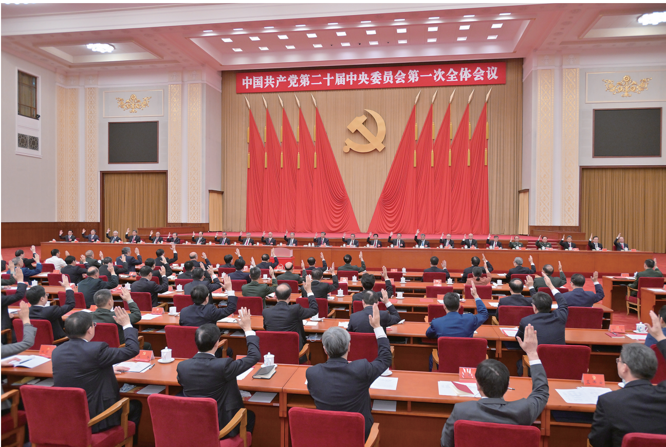
左图:10月23日,中国共产党第二十届中央委员会第一次全体会议在北京人民大会堂举行。习近平同志主持会议并在当选中共中央委员会总书记后作重要讲话。