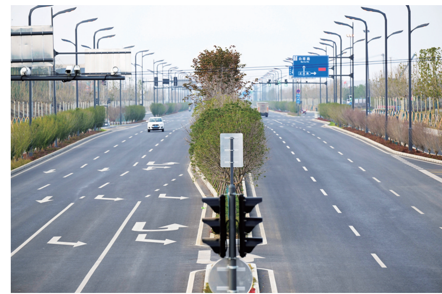
这是10月31日拍摄的由中铁十局承建的合肥新桥科技创新示范区道路。近年来，安徽省合肥市经开区积极加强企业园区基础设施建设，加快企业园区路网、管网施工进度，提升园区承载力，助力园区企业发展。

此次，山西省有70个村落榜上有名。其中，我市灵丘县下关乡杨庄村是颇受游客青睐的红色旅游打卡地，白求恩特种外科医院遗址位于该村，目前医院旧址保存基本完好。灵丘县独峪乡曲回寺村风景秀美，村里唐代曲回寺遗址周边的石塔因其形如墓冢，被称为“石冢家”。2001年，为保护这些珍贵的唐代石雕组群，国务院将其确定为全国重点文物保护单位。目前，曲回寺村建有曲回寺石冢冢博物馆，可供游客参观。永嘉堡村位于天镇县南洋河北岸，为长城边堡，目前永嘉堡东、北、西三面堡墙保存比较完整。