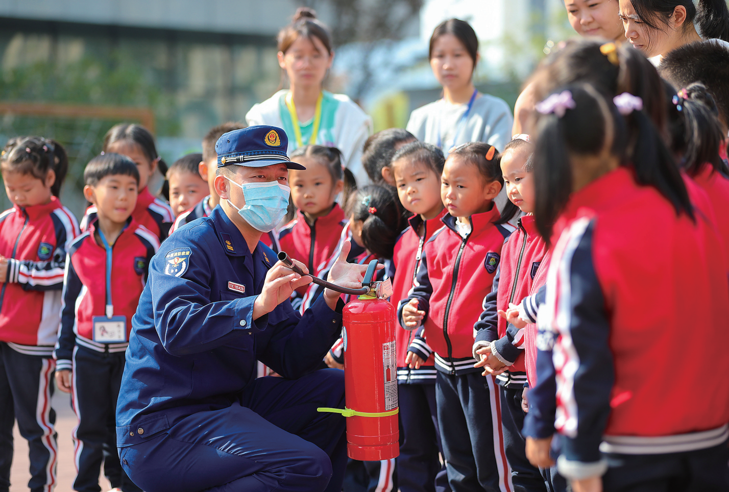
11月8日，在浙江省湖州市德清县武康街道一幼儿园，消防员向小朋友讲解灭火器的使用方法。

收到检察建议后，相关职能部门高度重视，立即责成执法人员对共享电动车乱停放问题进行调查，开展共享电动车乱象专项整治；同时约谈共享电动车负责人，限期整改，通过共享电动车后台技术设置规范共享电动车停放。下一步，阳高县人民检察院将关注低龄未成年人骑车上路、多人乘车等现象，积极督促相关部门加强监督管理，避免发生交通事故，防止损害社会公共利益，让共享电动车真正服务大众、方便大众。