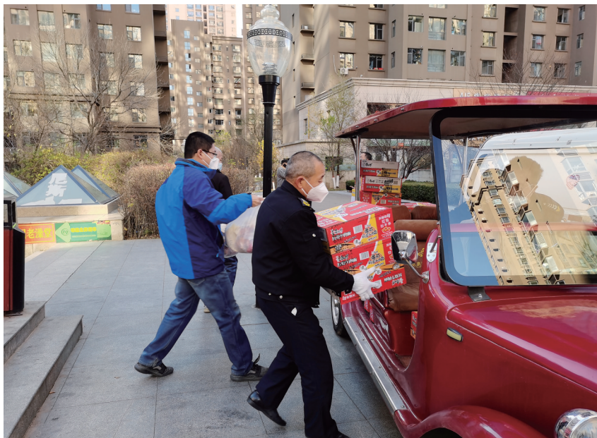
图为水泉湾龙园物业工作人员正在搬运保供物资。