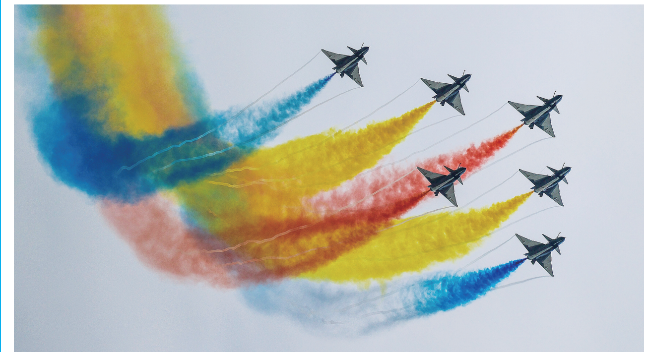
11月8日，中国空军八一飞行表演队进行飞行表演。当日，第十四届中国国际航空航天博览会在广东珠海开幕。

也具备很高的实战价值。作为空军“学院派”飞行表演队的空军航空大学“红鹰”飞行表演队，以“飞出惊险、飞出极限、飞出震撼”而著称。针对珠海的天气与地域特点，他们今年增加了八机通场、八机盘旋等动作，表演更紧凑、更有看点。 4架歼-20以四机钻石队形低空