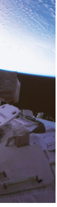
11月17日在北京航天飞行控制中心拍摄的航天员陈冬成功出舱的画面。 记者从中国载人航天工程办公室了解到，神舟十四号乘组17日进行第三次出舱活动。

管控6例、居家隔离管控2例、闭环管理重点人员筛查3例。新增的25例无症状感染者中，平城区18例、云冈区6例、浑源县1例。其中，管控范围内发现24例，分别为集中隔离管控18例、居家隔离管控2例、闭环管理重点人员筛查4例；非管控范围内发现1例，为静默管理状态社区筛查发现，在平城区御锦源南区。 11月16日，治愈出院1例，在云冈区。解除医学观察1例，在平城区。平城区2例无症状感染者转为确诊病例。截至11月16日24时，我市现有在院隔离治疗784例，其中，平城区451例、云冈区129例、云州区159例、浑源县42例、左云县2例、天镇县