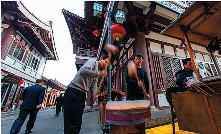
云冈食货街民俗风情