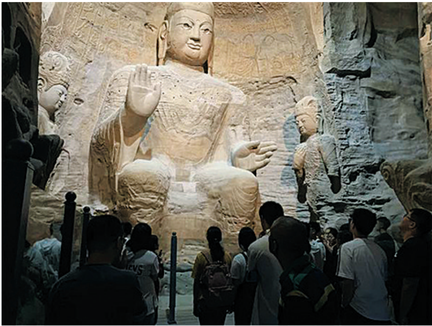
云冈第3窟3D打印佛像

与上海复旦规划建设建筑设计研究院合作编制的《云冈历史文化长廊旅游总体规划》已完成。项目规划建设范围东起云冈镇小站村，西至高山镇，面积约120平方公里，已纳入大同市转型发展重点工程。云冈景区被山西省市场监督管理局列为全省第一批服务标准化试点景区，对景区卫生间等基础设施和园林绿化进行提质升级。编制出台《云