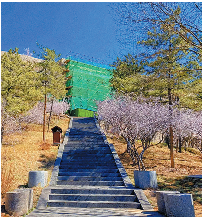
第38——40窟保养维护工程