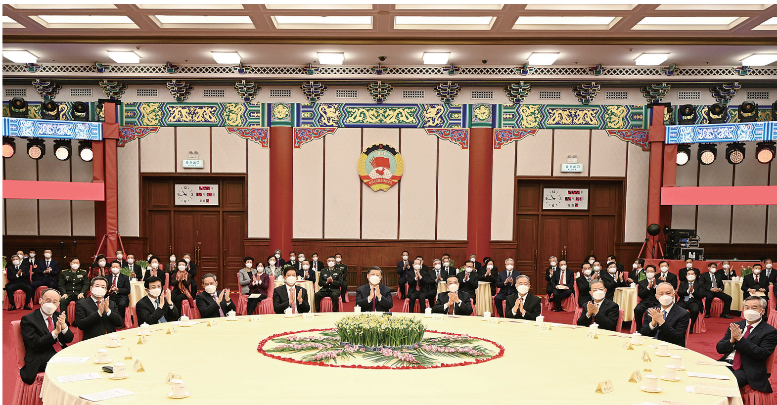
12月30日，全国政协在北京举行新年茶话会。党和国家领导人习近平、李克强、栗战书、汪洋、李强、赵乐际、王沪宁、蔡奇、丁薛祥、李希、王岐山出席茶话会并观看演出。

新华社北京12月30日电 中国人民政治协商会议全国委员会12月30日上午在全国政协礼堂举行新年茶话会。党和国家领导人习近平、李克强、栗战书、汪洋、李强、赵乐际、王沪宁、蔡奇、丁薛祥、李希、王岐山等同各民主党派中央、全国工商联负责人和无党派人士代表、中央和国家机关有关方面负责人以及首都各界人士代表欢聚一堂，共迎2023年元旦。 中共中央总书记、国家主席、中央军委主席习近平在茶话会上发表重要讲话。他强调，2023年是全面贯彻党的二十大精神的关键一年。开局关乎全局，起步决定后程。我们要以斗争精神迎接挑战，以奋进拼搏开辟未来，努力实现全年目标任务，为实现第二个百年奋斗目标奠定良好基础。 习近平代表中共中央、国务院和中央军委，向各民主党派、工商联和无党派人士，向全国各族人民，向香港同胞、澳门同胞、台湾同胞和海外侨胞，向关心和支持中国现代化建设的