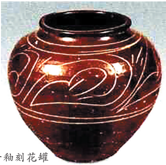
一、辽金大同瓷窑概況

大同地区在辽金元时期，制瓷资源丰富，传统制瓷业发达，基本形成以大同浑源窑、怀仁窑、青瓷窑为代表，遍布整个西京地区的陶瓷生产格局。该地区亦成为中国北方重要的陶瓷生产基地。从考古资料来看，浑源窑至迟在唐代就开始大量生产瓷器，发展到辽金元时期，已基本形成以烧制磁州窑系瓷器为主，兼烧定窑、钧窑瓷的生产格局，其生产工艺不仅影响周边地区，甚至波及西夏和高丽地区。乾隆《浑源州志》记载：“天赞初与王郁略地燕赵破磁窑镇”，知在五代后梁时浑源已有磁窑镇地名。经实地考察，浑源窑当建于唐代，终于元代，烧白釉、黑褐釉、茶叶末釉等品种。金元时期窑场扩大，品种增多，有黑釉剔花、白釉剔花与划花，器形有盘、碗、盆、罐、枕等。黑釉剔花为雁北地区之最精者，牙白釉剔花在山西其