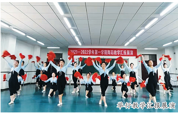
举行教学汇报展演