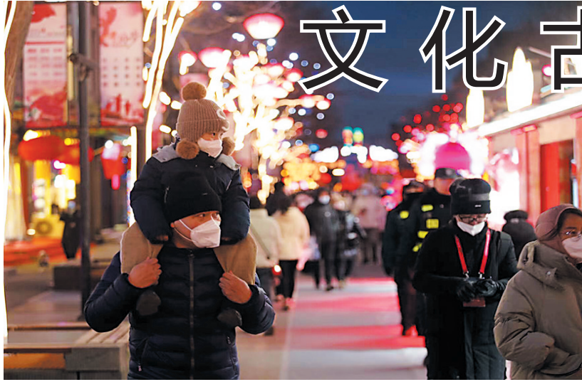
市民在古城内游玩。

春节是个欢乐祥和的节日，也是亲人团聚的日子，每个地方都有不同的风俗习惯，文化古都大同的“春节仪式”也是丰富多彩。春节期间，记者在走访中获悉，2023年大同人的春节文化故事依然十分精彩，“大同年·大同”新春文化系列活动也呈现出经典、欢乐、精致的新气象，展现出活力十足、文化味道浓郁的新魅力。