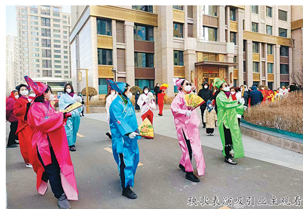
秧歌表演吸引业主观看

震天的锣鼓敲起来,红红的秧歌扭起来,甜甜的糖葫芦、棉花糖吃起来,有趣的套圈游戏做起来。兔年春节,碧水云天系列小区丰富多彩的春节文化活动红红火火,让广大业主度过一个喜庆欢乐的春节。