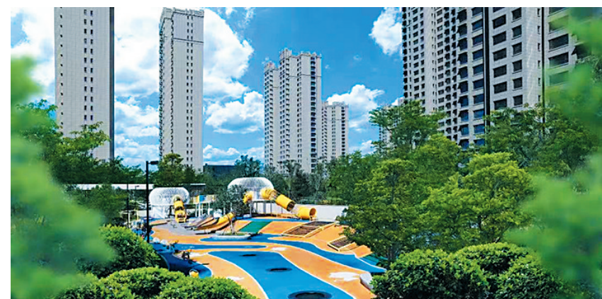
交通便捷 畅享都市繁华