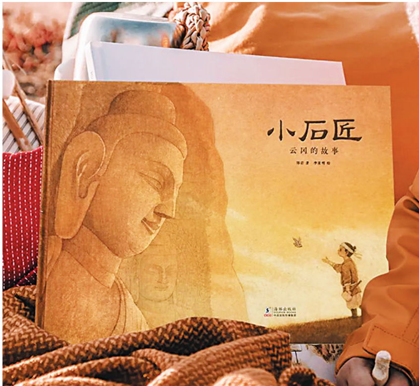
《小石匠：云冈的故事》绘本封面

云冈石窟是佛教传入中国后第一个由国家支持开凿的石窟群，规模很大，东西长约1公里，现存45个大洞窟，每个大洞窟还附带一些小型窟龕，石窟共有5万多尊造像，最大的造像高达17米，最小的只有2厘米。2001年，云冈石窟被联合国教科文组织列入世界文化遗产名录。