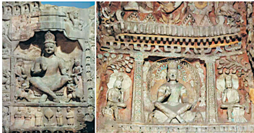
云冈石窟盪顶形龕的中国化尝试

其次，云冈早期洞窟已针对盪顶形龕进行中国化的改造尝试，如将犍陀罗盪顶形与汉式庑殿顶相结合，但由于做法杂糅，不符合时人审美观，遂未流行。中后期洞窟则采取不同路径，保留了传统的三开间形制和龕内的交脚弥勒题材，只是将建筑元素转变为汉式。冉教授特别指出，此类龕的本质仍为三开间盪顶，其开凿逻辑与同时期为安置七佛而设、无开间、仅有大屋顶的屋形龕不同，侧面证明了题材对于龕形的决定作用。