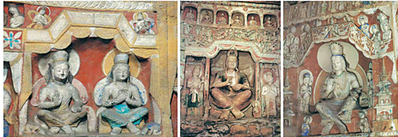
云冈石窟盪顶形龕的融合与创新

本项目今年1月正式启动，聚焦石质文物内部凝结水形成规律以及凝结水对复杂风化石质文物的破坏机制这两大科学问题，开展凝结水监测与综合智能治理的关键技术与方法研究。预计2025年底实现凝结水的实时智能感知，构建融“自然通风+人工调控”于一体、具有自适应反馈功能的凝结水治理智能解决方案，为相关石窟文物保护提供技术支持，为保护好云冈石窟乃至亚洲同类型文化遗产做出贡献。