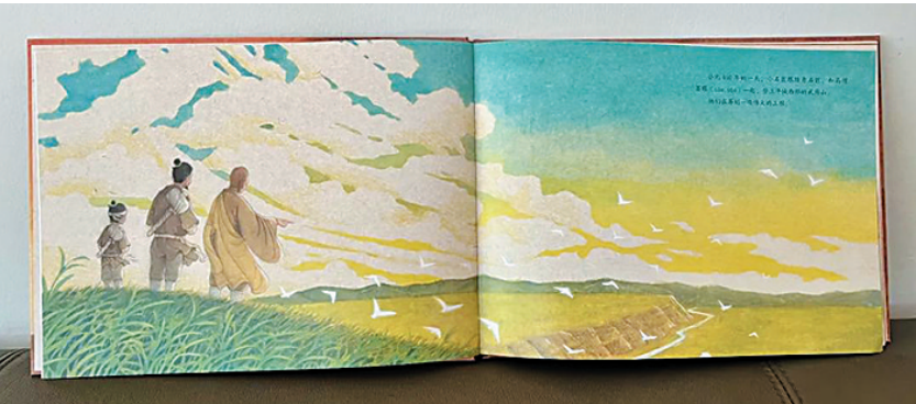
上三图为《小石匠：云冈的故事》绘本内容