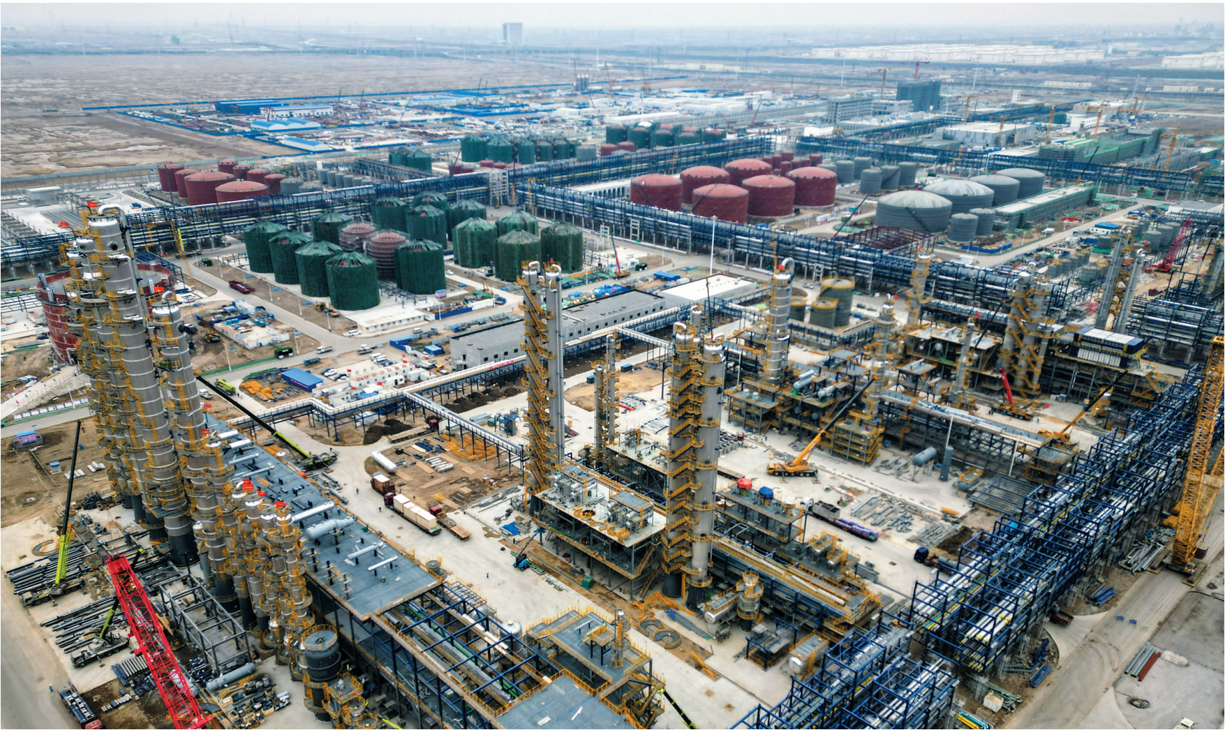
这是2月9日拍摄的天津南港乙烯项目建设施工现场（无人机照片）。近日，天津市公布2023年重点建设项目共673个，总投资达1.53万亿元。新年伊始，建设中的部分重点项目现场塔吊林立、机器轰鸣，建设者们用十足的干劲儿为经济高质量发展注入热活力。

灾应急救援等突发事件的应急处置程序和措施，真正做到让老人开心、子女安心、组织放心。 “东尾毛村‘党建+颐养之家’项目不仅提升了基层党组织的战斗力和战斗力，更缓解了农村的养老难题，满足了农村居家养老的基本需求，真正实现了党建工作和民生事业的同频共振，成为百姓幸福的暖心工程。今后，我们将继续完善服务设施，提高服务能力，进一步提升老年人的获得感、幸福感、安全感。”该乡相关负责人表示。