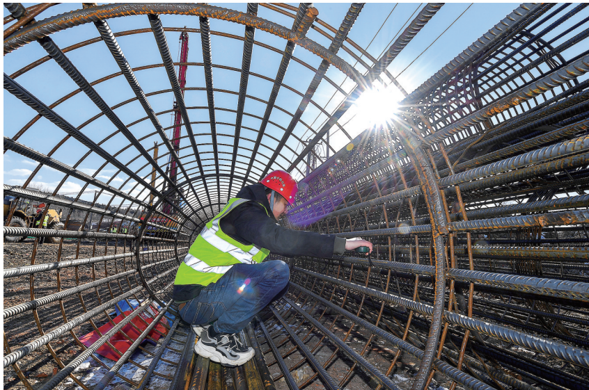
2月14日，工人在由中铁七局承建的长春市东南湖大路工程一标段二工区进行施工作业。近日，随着气温逐步回暖，吉林省长春市多个重点城建项目陆续开工、复工。

实行后备人才“雏雁成长”计划，培育乡村振兴“后备军”。该县坚持德才兼备、以德为先的选人标准和注重实绩、群众公认的用人导向，把188名优秀年轻人才纳入村级后备干部库。择优推荐236名导师，组织建立“一对一”“多对一”结对帮带机制，实行动态管理、梯次培养。注重人才政治激励，扎实开展“将党员培养成能人、将能人培养成党员”的“双培工程”，吸收23名乡土人才进行重点培养，积极推荐优秀乡土人才参选各级“两代表一委员”，682名优秀乡土人才入选村“两委”班子，充分发挥“党员+人才”双翼共振的致富辐射带动作用。