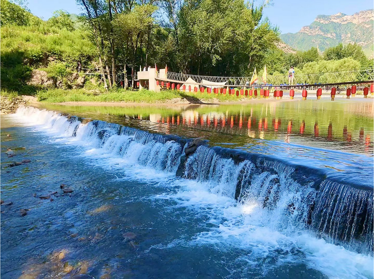
灵丘县花塔村水清树绿景色美。

“今年1~9月，我市国考断面在全国338个重点城市地表水环境质量改善幅度排名第4，水环境质量稳定达标并得到显著改善。这与我们持续强化源头治理、精准治污的扎实举措息息相关。”说起这项亮眼的成绩单，市生态环境局工作人员深有感触。