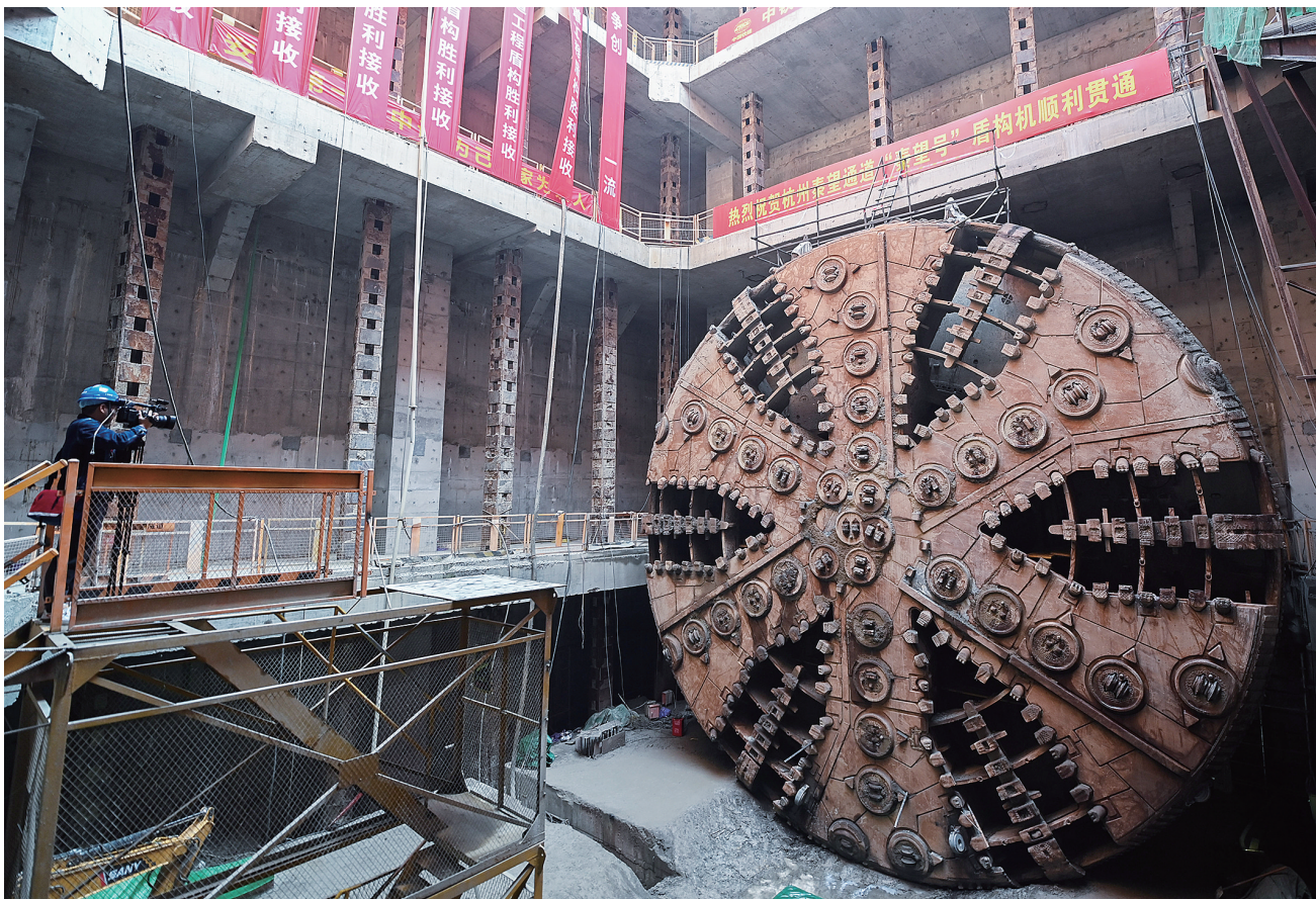
这是泰望通道工程过江隧道江北工作井下已完成隧道盾构作业的“泰望号”大型盾构机（3月9日报）。当日，浙江省杭州市富阳区泰望通道工程过江隧道实现双线贯通。