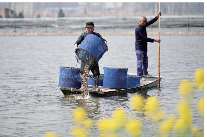
3月9日，在安徽省蚌埠市五河县小圩镇，蟹农在投放蟹苗。近日，安徽省蚌埠市五河县螃蟹养殖户抢抓晴好天气投放蟹苗，蟹塘上一片忙碌景象。

完善体系建设，规范权力运行。该公司完善法人治理结构，成立了党组织、董事会、监事会，任命了公司经理，各个治理主体的职责边界明确、权责明晰。严格执行“三重一大”决策制度，在去年年底收购玉米过程中，玉米收购标准和价格、设备采购、合同签订均通过董事会研究决策。每次重大事项研究，公司监事均参会，对董事会的决策部署、设备招标与物品采购等进行全过程监督。建立健全企业管理制度，先后制定了公司经理、检验科、财务科等岗位责任制和管理制度，建立了《粮食检验、检查制度》《安全生产管理制度》等一系列制度，进一步规范各岗位员工工作行为。