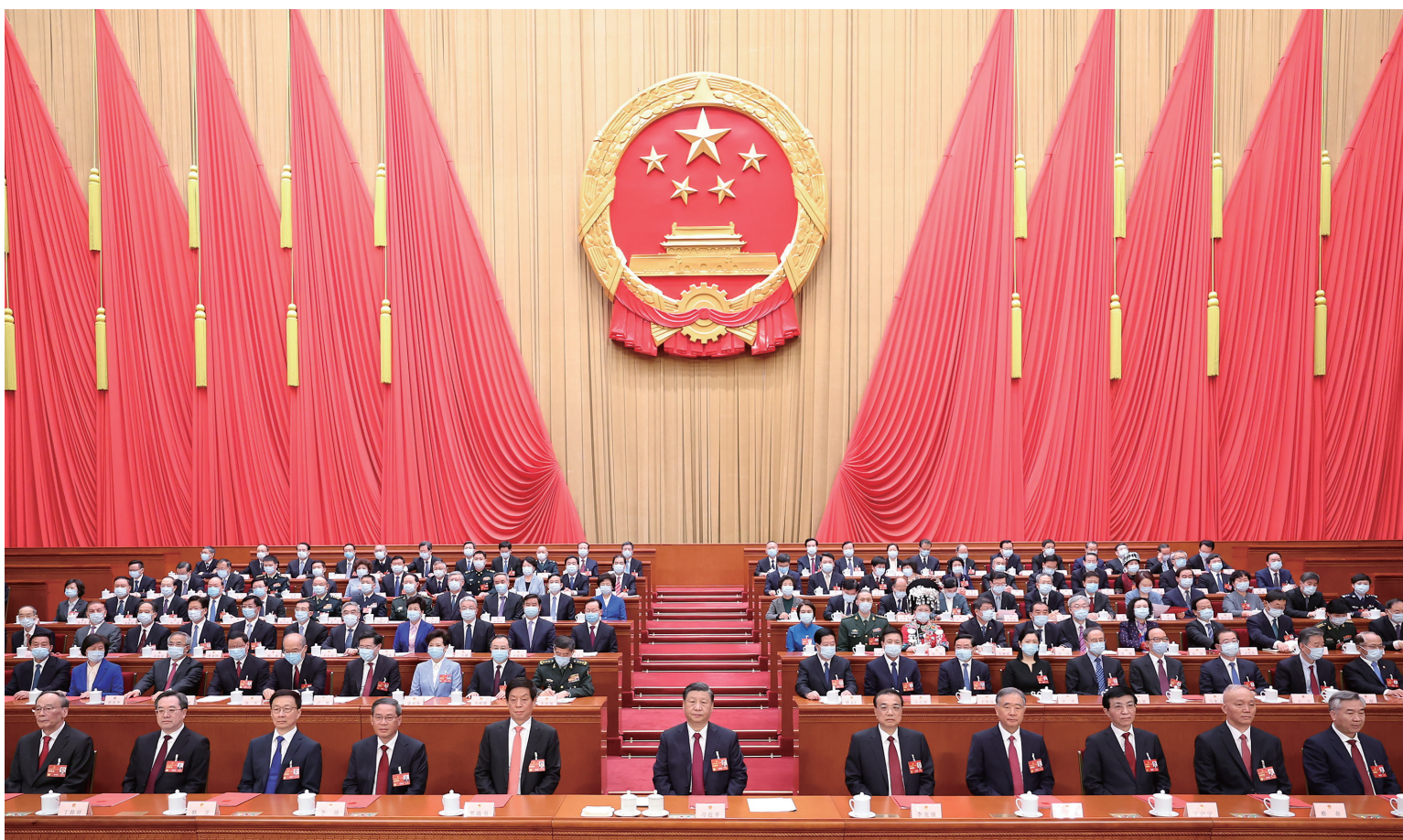
3月13日,第十四届全国人民代表大会第一次会议在北京人民大会堂闭幕。习近平等党和国家领导人在主席台就座。