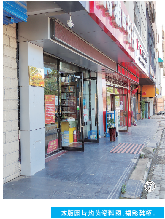
本版照片均为资料图,摄影权等。