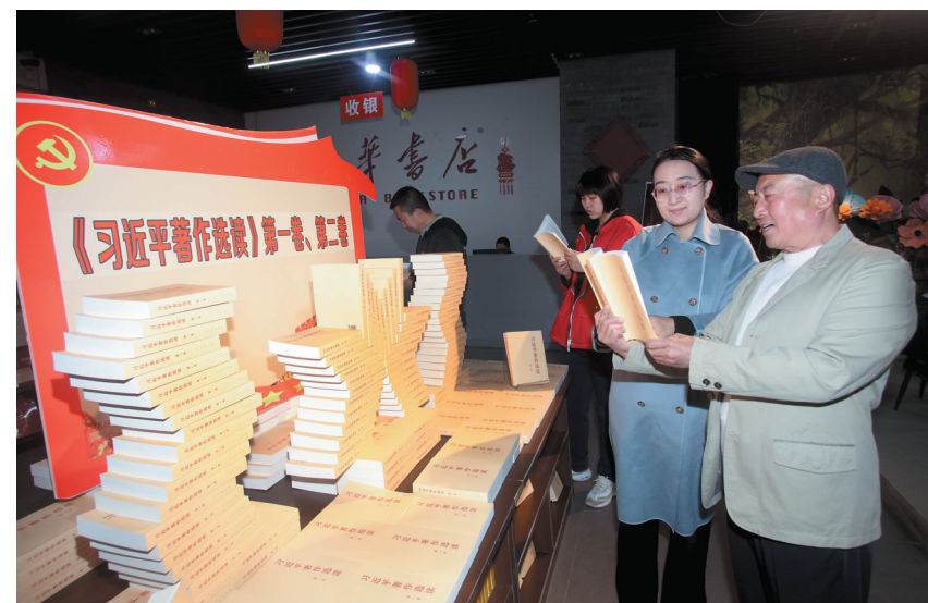
图为读者正在市新华书店阅读《习近平著作选读》。

本报讯（记者 王春艳）近日，中共中央发出关于学习《习近平著作选读》第一卷、第二卷的通知。市新华书店积极做好《习近平著作选读》第一卷、第二卷在本市的发行工作。目前，该书已在市新华书店和阳书店和文瀛书屋陈列上架。