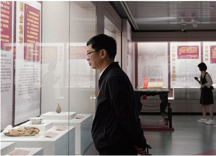
4月17日，观众在参观展览。 当日，“精神之路——中国共产党人伟大精神文物史料专题展”在上海中共一大纪念馆专题展厅开幕。展览由上海中共一大纪念馆联合西柏坡纪念馆、井冈山革命博物馆、延安革命纪念馆等全国各地25家场馆举办，共展出40件（套）珍贵文物和展品。展览向公众免费开放，将持续至7月下旬。

成效，发挥示范带动作用，全面提升“博爱家园”品牌影响力。 据悉，“博爱家园”是中国红十字会借鉴国际红十字组织“社区为本”理念和模式，在基层开展的惠民项目。该项目以“防灾减灾、产业帮扶、健康促进、精神文明”为主要内容，通过动员各方资源，为乡村援建公共服务设施并提供产业帮扶支持。截至目前，全国红十字系统共募集投入资金12亿元，在31个省份、5506个农村社区实施“博爱家园”项目。 徐晓兰说，开放合作是科技创新的内在要求和重要路径，产学研深度融合越来越成为加速技术更新迭代、扩大技术推广应用、促进科技成果转化有效途径。加强产学研合作，是攻坚关键核心 获等特性，在北纬27度生育期170天左右，越往南方生育期越短，为破解南方冬闲田三熟制生产瓶颈提供了突破性品种支撑。其中，在广西柳州市柳南区示范点生育期仅156天。 “以亩产175.7公斤、含油量44.16%估算，推动‘中油早1号’等短生育期油菜品种在我国冬闲田区域应用，每年可实现增加油菜籽1124.5万吨左右，增加菜籽油供给496.6万吨左右，使我国食用植物油自给率提高12个百分点左右。”中国农科院油料作物研究所油菜遗传育种研究室副主任王新发对记者说。