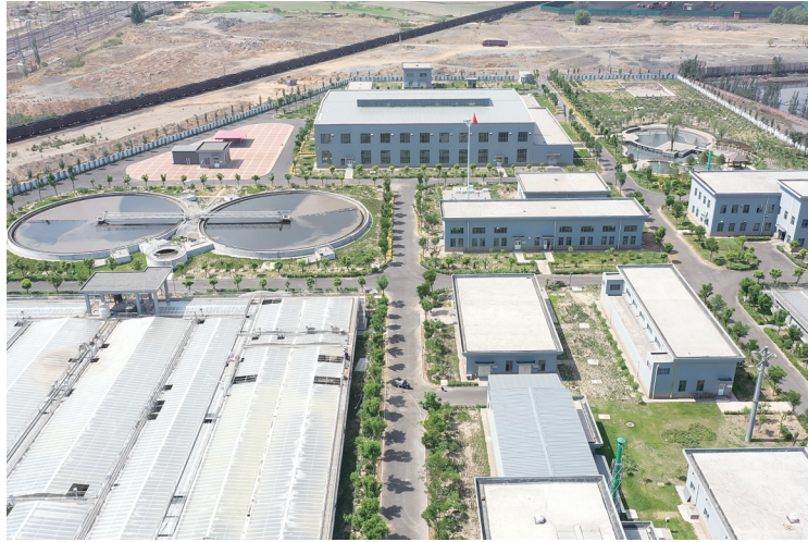
农发行大同市分行支持的恒安新区生态环境建设与保护项目。

深入开展小微企业服务优化工程,推行“一户企业、一个专班、一套方案、一抓到底”的金融服务机制,针对普惠企业短小频急的融资需求,开辟绿色通道,提供优质高效的一站式金融服务,全力打通金融惠企“最后一公里”。累计支持普惠小微企业13户,投放贷款0.85亿元,为普惠企业注入高速发展动能。