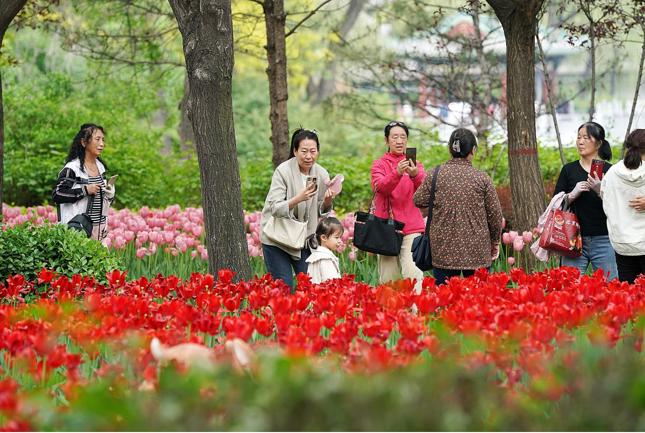
5月10日，游客在太原市迎泽公园拍照留影。近日，山西省太原市迎泽公园内各色郁金香竞相绽放，吸引游人前来观赏美景。

市检察院出台“二十一条”举措护航法治化营商环境 本报讯（记者 潘红）近日，市检察院决定在全市检察机关集中开展护航法治化营商环境专项行动，并制定了《大同市检察机关护航法治化营商环境专项行动方案》。 该方案以四大检察全面履职为核心、以多元综合司法保护为基础，立足大同实际制定21条具体措施，着力优化法治化营商环境，为我市高质量发展提供更具司法保障。重点惩治侵犯企业权益及企业人员人身、财产权利的刑事犯罪，营造平安稳定的社会环境。该方案重点惩治破坏市场秩序、侵犯企业产权和合法权益的经济犯罪，营造诚信有序的市场环境。强化对涉及企业相关案件诉讼活动的法律监督，维护企业合法权益和司法公正。办好涉企金融类案件、办好涉企职务犯罪案件、办好涉企新型案件，稳妥推进涉案企业合规重大改革工作，全面推进知识产权四大检察融合履职改革工作，做强涉企民事执行专项监督和涉企民事生效裁判专项监督工作，做实涉企行政检察监督工作，公益诉讼助推依法行政和企业经营，依法办理涉企控告申诉案件，通过全面加强涉企案件财产强制性措施法律监督，深化适用认罪认罚从宽等多种措施为企业发展释放大最大的司法善意。依托12309检察服务中心建立企业信访绿色通道，畅通企业诉求反映渠道。充分发挥检察机关派驻工商联或民营企业服务中心检察联络室、联络站、服务队等联络机制作用，深化与工商联的沟通协作机制。坚持和发展新时代“枫桥经验”，依法妥善化解涉企矛盾纠纷。优化刑行衔接环节服务措施，严格落实政法机关联合服务“四项机制”，充分发挥“1+N”法律服务专班作用，常态化开展企业法律服务。健全检察机关办理涉企案件容错机制，从严惩治检察干警损害营商环境问题。