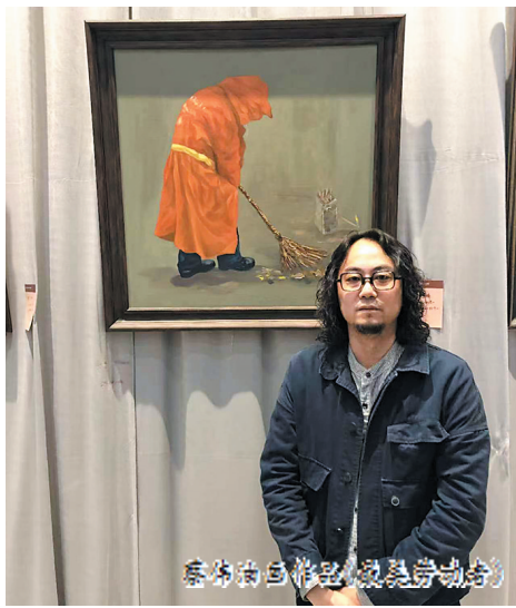
蔡伟油画作品《最美劳动者》