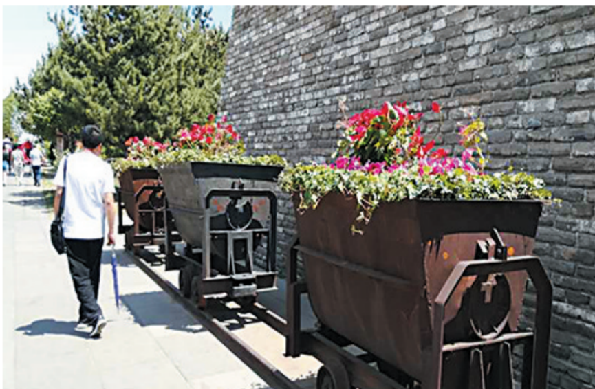
运煤的“黑牛车”变身大花盆