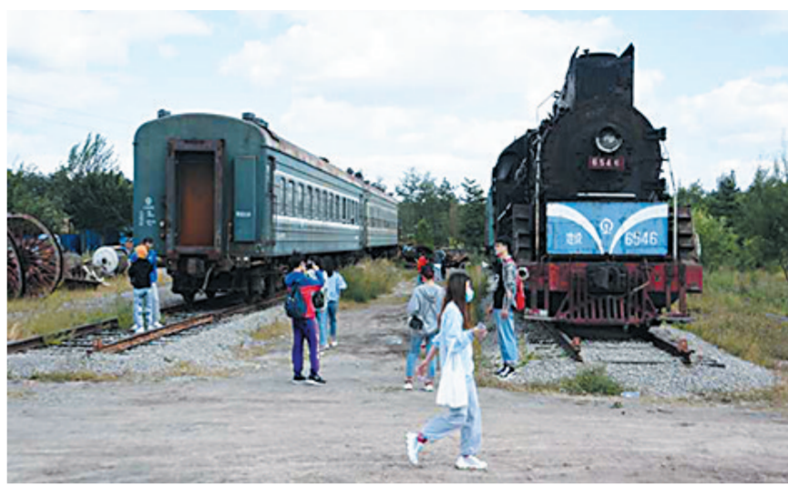
蒸汽机车被改造成机车公寓与餐厅

相关人士表示,云冈石窟工业文化园区获评优秀工业遗产保护利用示范案例,对于复制推广云冈经验有着十分重要的意义。云冈的做法如果在全国乃至更大范围推广开来,所产生的经济效益、社会效益、生态效益,将是难以估量的。