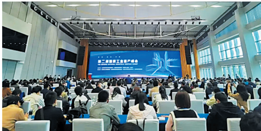
第二届国家工业遗产峰会会场

经过十多年的不懈努力,云冈研究院运用创新理念完善景区建设的做法赢得国家层面的高度认可。4月26日,第