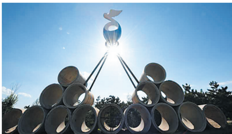
废水管子托起“和平鸽”雕塑