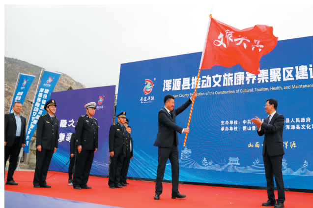
浑源县推动文旅康养集聚区建设促进高质量发展大会在恒山岳门湾广场举行

神溪国家湿地公园。这里风光旖旎，黑鹳、天鹅、苍鹭、黄鹌等水鸟翔集，苇丛丛生、渔舟摇曳，夏至荷叶接天、荷花映日，湖光山色一览无余。 中国恒山黄芪博物馆——黄芪文化园。《本草纲目》称黄芪为“补药之长”。浑源是“正北芪”原产地，“黄芪之乡”，黄芪文化园是集展览、康养、体验、消费等于一体的一站式黄芪综合体验空间。