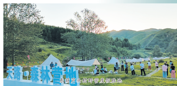
天路·森林营地 东葫芦头村野奢度假营地