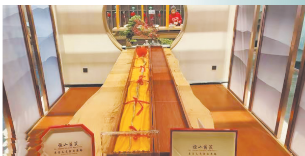
3A级景区黄芪文化园内黄芪展品