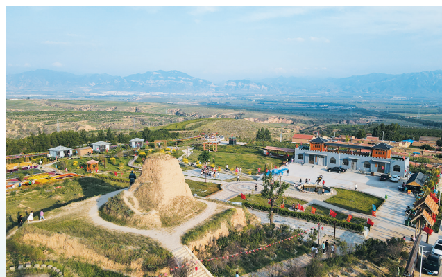
二岭乡村旅游示范村

3A级旅游景区——浑源州署。浑源州署是我国北方现存的古官署衙门中独具特色的明清风格州衙建筑，素有“晋北第一府”的美誉。 锦茂草堂博物馆——麻家大院。麻家大院是一组规模宏大、规格较高的古民居建筑群，现存房屋73间，院套院、宅相连，木雕、砖雕艺术精美。