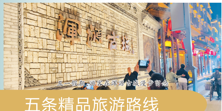
五一假期，游客在浑源古城漫步留念

让浑源古城有人气、有烟火气、更有财气；按照有品位、有品质、有品牌的定位，打造配套设施完善、行业要素齐全、服务优质全面、环境优美舒适的文旅发展大格局，配得上北岳恒山的尊崇地位。浑源县始终把康养作为发展重心，不断提升康养产业比重。积极承接北京、天津、河北等地的康养外溢群体，依托风景名胜、绿色生态、温泉湿地、恒山黄芪等优势，推进发展集文旅康养、生态康养、中医康养、休闲康养于一体的复合型康养产业。聚焦东葫芦头、龙蓬峪、莲花山等乡村旅游节点，打造特色康养产业集聚区，构建串联全县旅游景区景点、民宿客栈、宾馆酒店，覆盖全域、全龄的多维度康养服务体系，打造浑源自有康养品牌，在同质化竞争中脱颖而出、领先领跑。