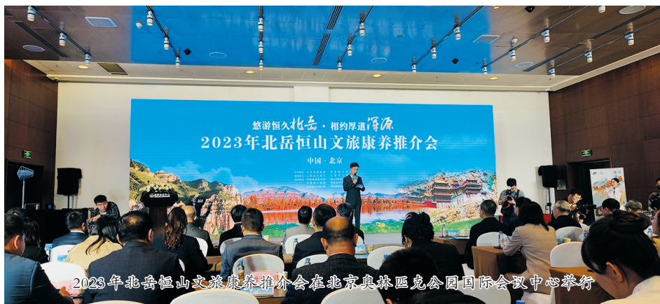
2023年北岳恒山文旅康养推介会在北京奥林匹克公园国际会议中心举行

“小欧洲森林公园”——东葫芦头度假村。东葫芦头度假村内有千年林海、万亩花田和悬空栈桥等自然景观和古村落、古长城等文化遗址，是一处“望得见山、看得见水、记得住乡愁”的世外桃源。 “塞外小黄山”——千佛岭。千佛岭奇俊秀美、林木茂盛、山水交融，掩映着千佛寺、碧峰寺、板方寺等佛教建筑，奇峰、怪石、林海、幽寺并称“佛岭四绝”，是浑源仅次于北岳恒山的又一处自然风光与人文景观兼具的景区。