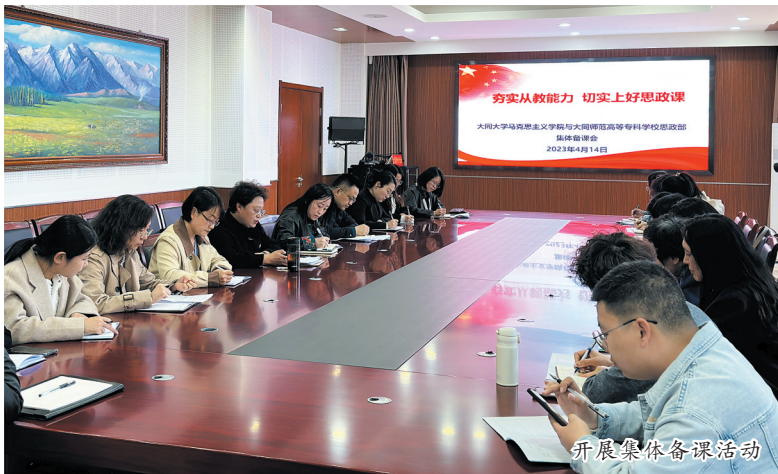
开展集体备课活动

本次活动拓展了大同二职中校企合作的实践途径,提高了职业教育教学水平,对实现新时代职业教育人才高质量发展起到了积极的促进作用。