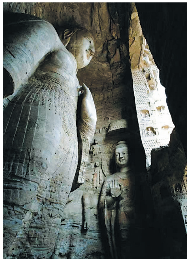
云冈石窟第18窟大佛