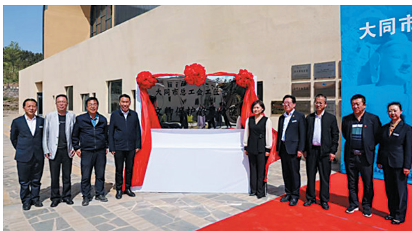
市总工会工匠学院文物保护修复分院揭牌现场

本报讯（记者 赵喜洋）5月26日，由大同市总工会主办、云冈研究院协办的“大同市总工会工匠学院文物保护修复分院”成立仪式在云冈研