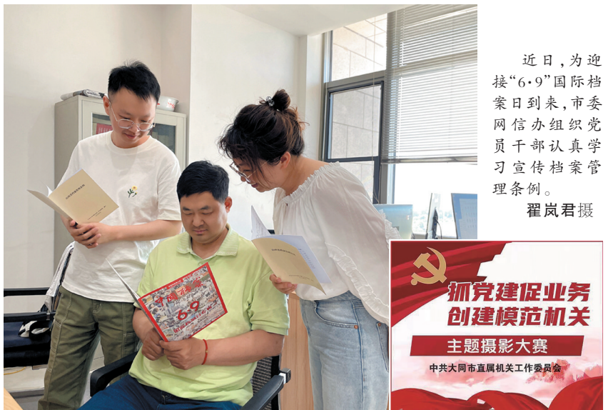
近日,为迎接“6·9”国际档案日到来,市委网信办组织党员干部认真学习宣传档案管理条例。

主,包括刺绣、剪纸、布艺、烫画、蜡染、泥塑、雕刻、纺织、书法、绘画等传统美术工艺技能,参赛者以现场竞技的方式展示民间高手的艺术和技术水平。现场,在优美音乐中,动态表演与静态表演穿插进行。舞台上,古筝演奏《舞乐舞曲》、金钱板说唱《秀才过沟》、二人台表演《送四门》等动态节目各具特色、精彩纷呈;刺绣《头顶牡丹花》、金属丝编《万事如意》、葫芦烫画制作、面塑《仿真花卉》等静态表演让观众领略了民间民间工艺美术的灵巧与独特。 据悉,此次大赛将选出的10名优秀乡土文化能人代表我市参加全省半决赛和决赛。