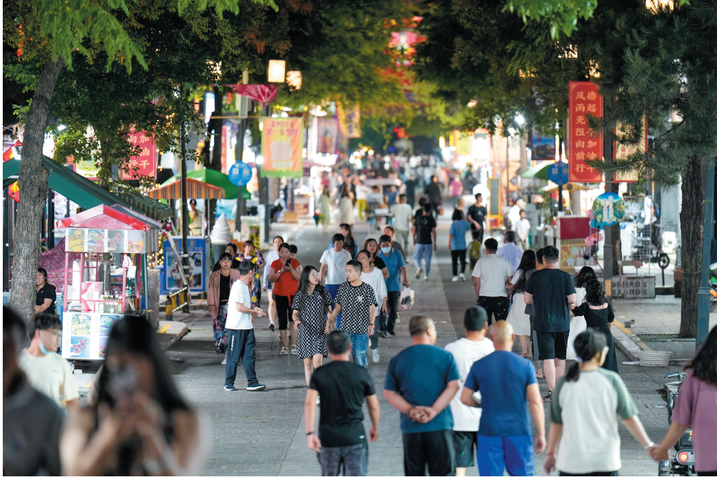
6月7日,游客在滦州古城景区内游览。 今年6月以来,河北省滦州市滦州古城景区通过开展多种夜间文旅项目,激发游客夜间消费需求,“夜经济”热度持续攀升,为城市增添了活力。