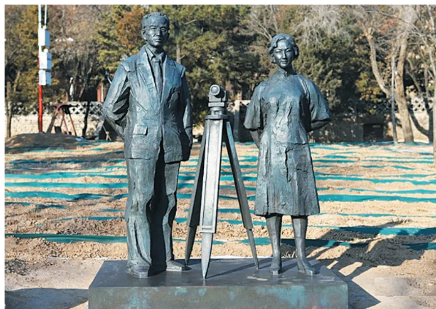
云冈景区内梁思成、林徽因纪念铜像

2020年11月，国务院办公厅印发了《关于加强石窟寺保护利用工作的指导意见》，文件指出：“我国石窟寺分布广泛、规模宏大、体系完整，集建筑、雕塑、壁画、书法等艺术于一体，充分体现了中华民族的审美追求、价值理