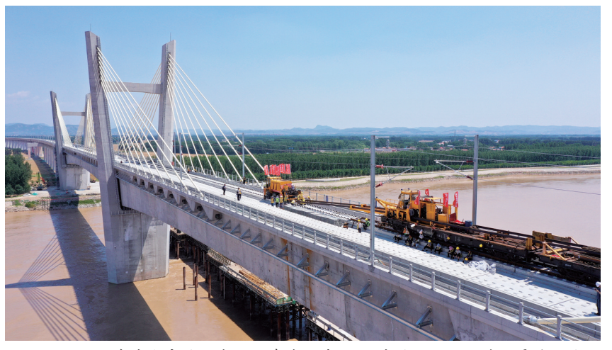
6月14日，在济郑高铁山东段长清黄河特大桥，中铁十局的工作人员进行铁轨铺设作业（无人机照片）。目前，济郑高铁各项建设任务正加快推进，长轨铺设已完成80%。据悉，济郑高铁是国家“八纵八横”高铁网的重要组成部分。项目通车后，济南到郑州的通行时间将缩短至1.5小时，将成为中原城市群与山东半岛城市群间的快速客运通道。