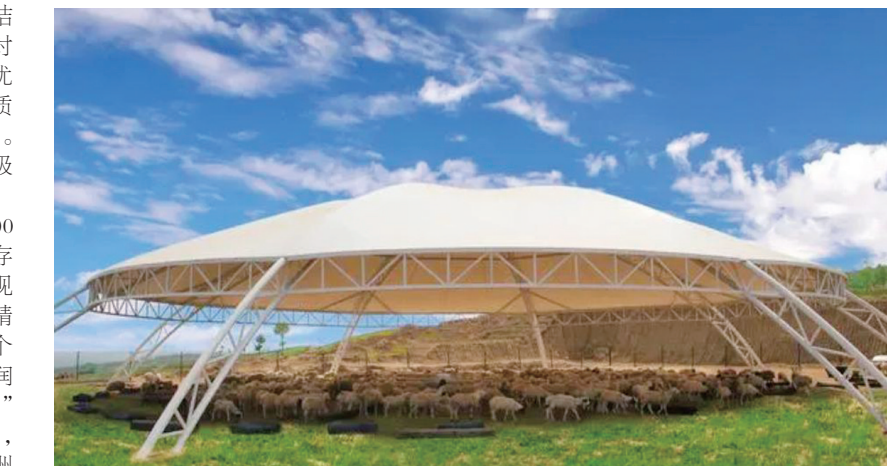
肉获2017年山西功能农产品品牌,右玉羊公司获得了“亲疙瘩”羊肉品

截至2022年底,全县存栏羊100只以上的规模化养殖场近15多个,存栏30只以上的养殖户2000余户。现在右玉当地生产的羊肉产品实现了精细分割,并有中西式两大系列百余个品种,已注册“祥和岭上”“千户侯”“润羊”“大西口”“绿洲羊”“猫耳窝”等20余个肉羊系列产品商标。其中,“祥和岭上”右玉羊肉品牌被2017亚洲(北京)国际食品展览会特别推荐,右玉县大西口农牧公司的“大西口牌”羊