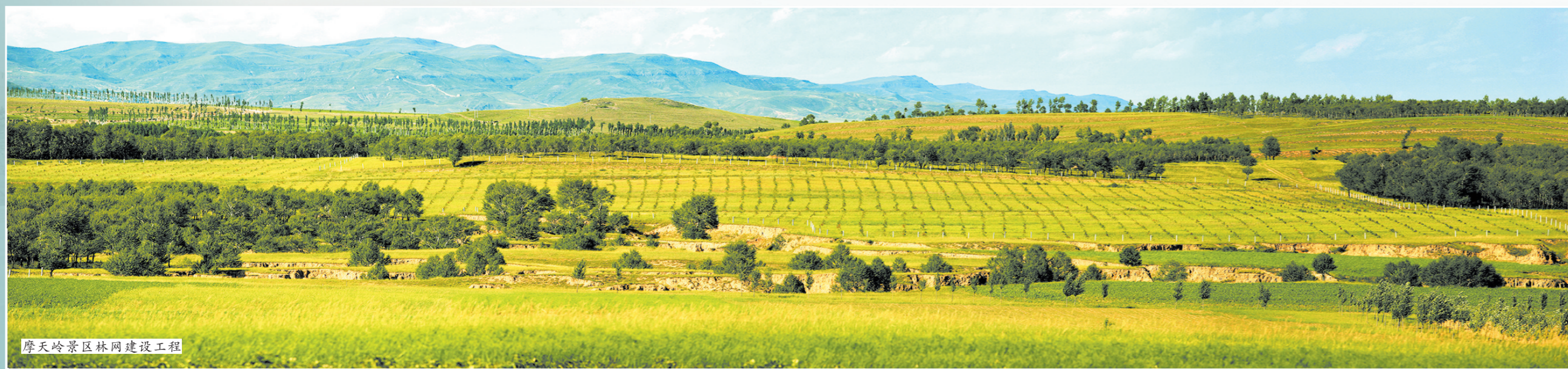
摩天岭景区林网建设工程

文化与旅游是一对“孪生兄弟”,文化与旅游之间存在着天然的耦合性,这也决定了文化与旅游具有很强的融合性,今日的左云,正以其独特的发展方式驶上高质量发展快车道。