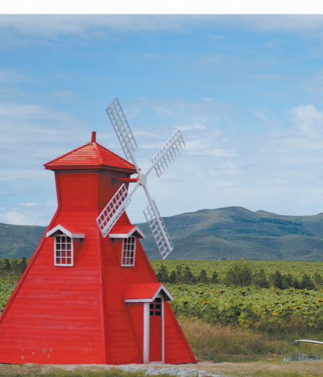
长城小镇风车小屋

二基地:即书画艺术写生基地和露营地小镇基地。书画艺术写生基地主要以现有书画院和艺术创作基地为基础,完善建设油画写生基地设施,积极拓展文创产业发展。与全国高校及科研院所对接,为更多的国内各类院校师生、艺术家提供课堂教学、商务会议、艺术交流、书画研究、住宿、餐饮等服务。露营地小镇基地主要包含自然探索营、热气球营地、篝火晚会、彩弹射击运动场、帐篷酒店、婚纱摄影基地、古代军营、周末小农场、科普课堂夏令营等,一幅美丽动人的文旅画卷,正在这片热土上徐徐展开。