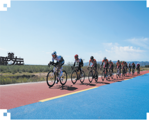
自行车运动员在长城1号旅游公路竞赛

多年来,左云县大力发展体育事业,全民健身氛围一直十分浓厚,早在1996年就荣获了“全国体育先进县”的称号,2017年又被国家体育总局命名为群众体育先进县。持续叫响的“文化+体育”品牌承载了全县人民对文旅事业太多期许,随着长城国家文化公园(左云段)的实施,自行车体育赛事品牌也必定会给该县带来更多的发展机遇。