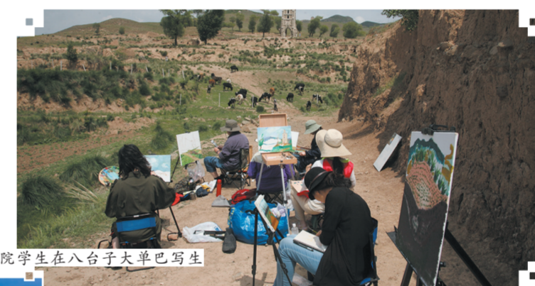
美院学生在八台子大单巴写生

“花园归元”酒店项目,七彩花田种植、“边塞风情”大型演出、边塞风情游;农副产品加工区,主要包含小杂粮加工项目、中药材种植及深加工项目、生态羊肉精加工项目,原生态禽畜复合颗粒饲料项目,山地运动区,主要包含山地徒步骑行和自行车赛事项目。