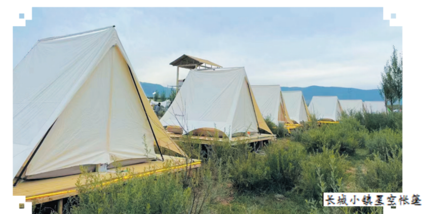
长城小镇星空帐篷