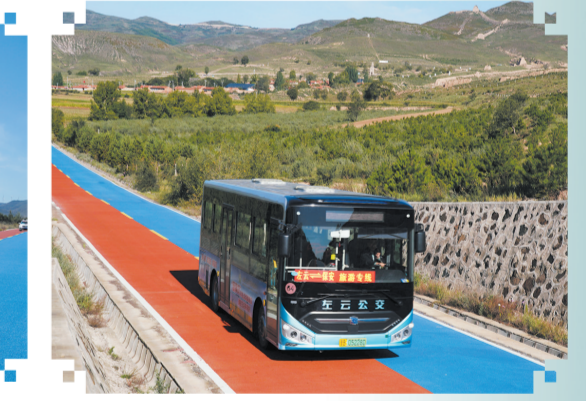
2021年,长城旅游专线开通