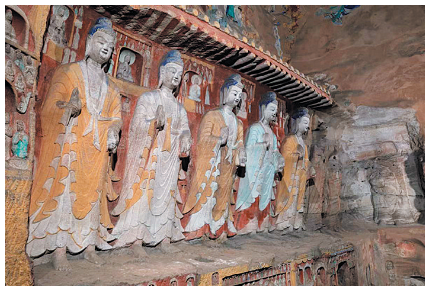
云冈第11窟七佛立像