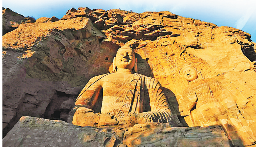
世界文化遗产大同云冈石窟

2020年5月11日,习近平总书记云冈石窟考察时强调,云冈石窟是世界文化遗产,保护好云冈石窟,不仅具有中国意义,而且具有世界意义。历史文化遗产是不可再生、不可替代的宝贵资源,要始终把保护放在第一位。发展旅游要以保护为前提,不能过度商业化,让旅游成为人们感悟中华文化、增强文化自信的过程。要深入挖掘云冈石窟蕴含的各民族交往交流交融的历史内涵,增强中华民族共同体意识。习近平总书记的重要指示,为云冈石窟的科学保护、云冈学的设立、云冈文化艺术的开发利用等各项工作,指明了方向,提供了根本遵循。 为贯彻落实习近平总书记重要