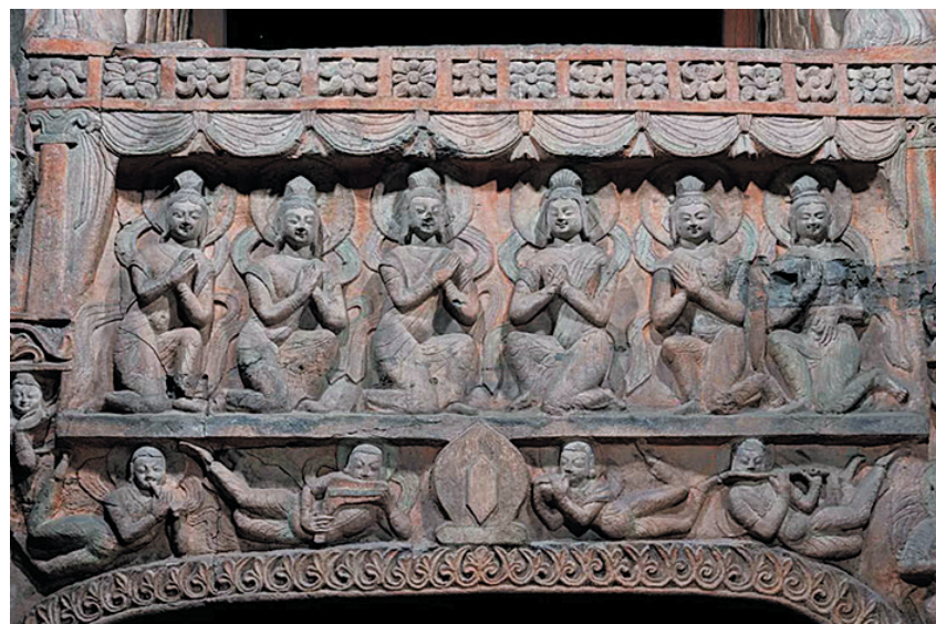
云冈第7窟供养天人和飞天

本报讯(记者 梁有福)云冈研究院2023年第二期精品研修班目前正面向全国招募学员。本期研修班将于6月29日开班,7月2日下午举办云冈文化沙龙,向学员颁发结业证书。 4天时间里,云冈研究院将依托文化遗产产地优势资源,让学员们近距离感受云冈石窟的文化内涵,进行古建筑、佛造像、文物修复的研修学习,见证雄浑壮美的北魏,遇见民族融合的辽金,体味九边重镇的明清。