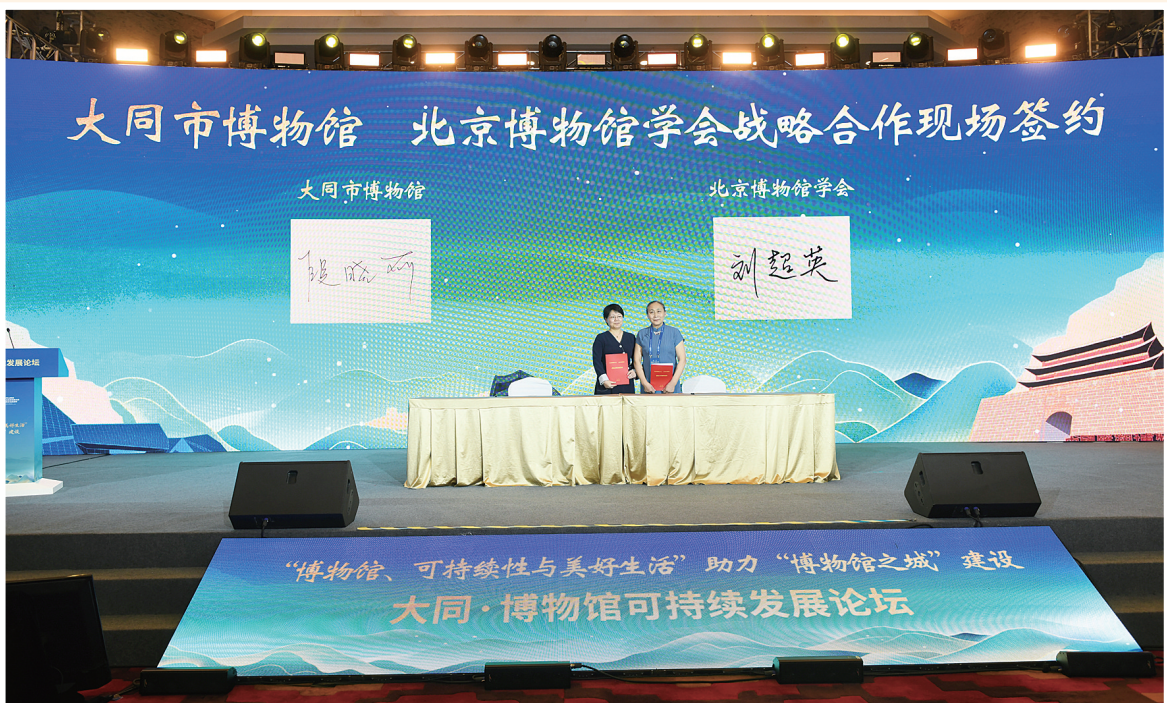
大同市博物馆与北京博物馆学会战略合作现场签约。