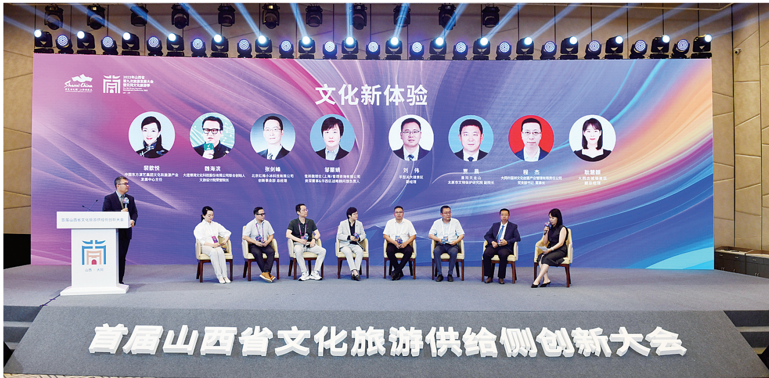
文旅供给侧创新大会文化新体验的供需对话环节。