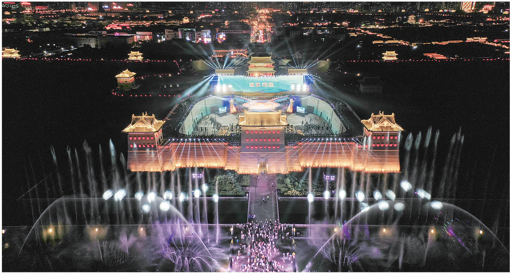
6月27日晚，2023年山西省第九次旅游发展大会暨云冈文化旅游季在大同古城南城墙关城开幕。