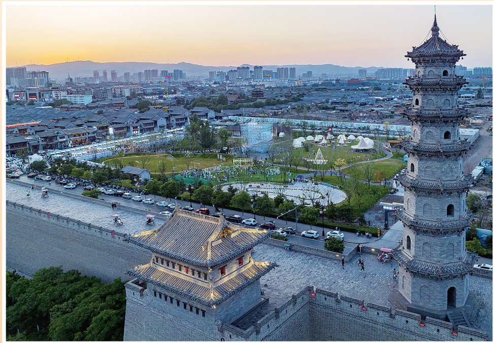
大同古城东南邑举办的各项文化活动带火古城。