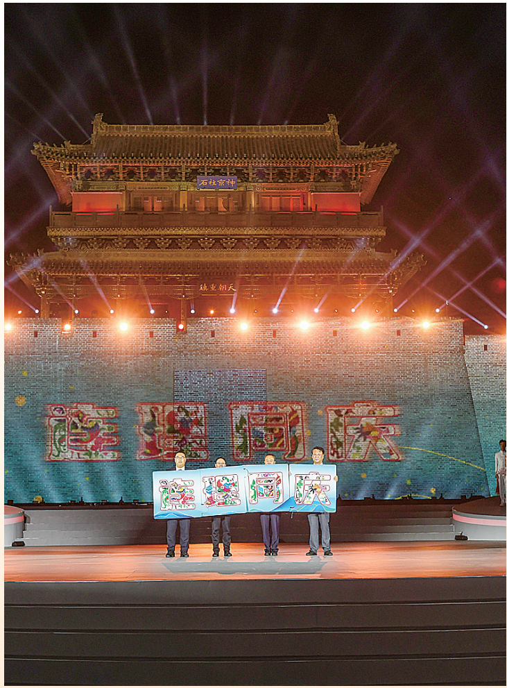
“连理同庆”友好城市协作合作签约。