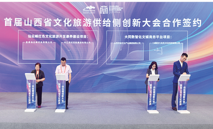
文旅供给侧创新大会现场签约。