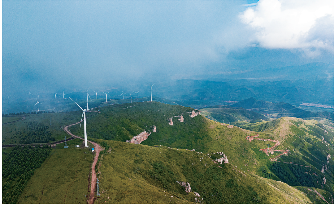
位于阳高县与广灵县交界处的向顶山海拔2008米,高山草甸草甸胜景,植被茂密,物种丰富,是一片难得的天然绿洲。由于近日降雨频繁,使得草原上空风云变幻,游客在此时常能体验白云与人擦肩而过的奇妙感受。图为7月27日云雾中的向顶山。