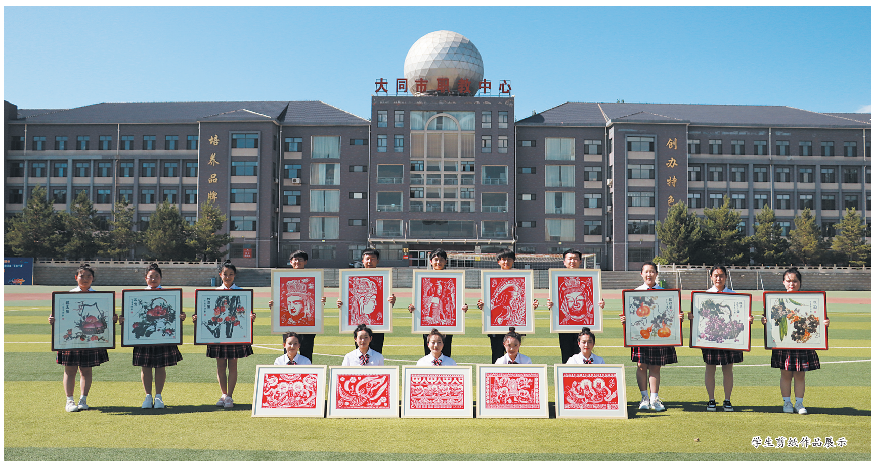
学生剪纸作品展示

为做好毕业生就业工作,该校早部署、早行动,通过制定就业方案、收集就业信息、搭建就业平台、加强宣传教育、强化学生就业辅导等有效途径,助力毕业生好就业、就好业。同时,各系部细致摸排每位学生的家庭情况、就业意愿、就业现状等,着力做好家庭经济困难等特殊群体毕业生就业帮扶指导工作,精准施策、分类指导,引导毕业生主动求职,帮助毕业生落实就业去向,全力促进毕业生高质量就业。