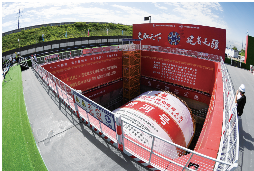
这是8月21日在北京东六环改造工程东线隧道接收井中拍摄的“运河号”盾构机。当日,随着国产首台16米级直径盾构机“运河号”在北京通州区土桥新桥西北侧顺利接收,北京东六环改造工程东线隧道贯通,这也标志着我国最长盾构高速公路隧道实现双线贯通。北京东六环改造工程是落实新版北京市总体规划的重大工程。今年6月,工程西线隧道已率先贯通。