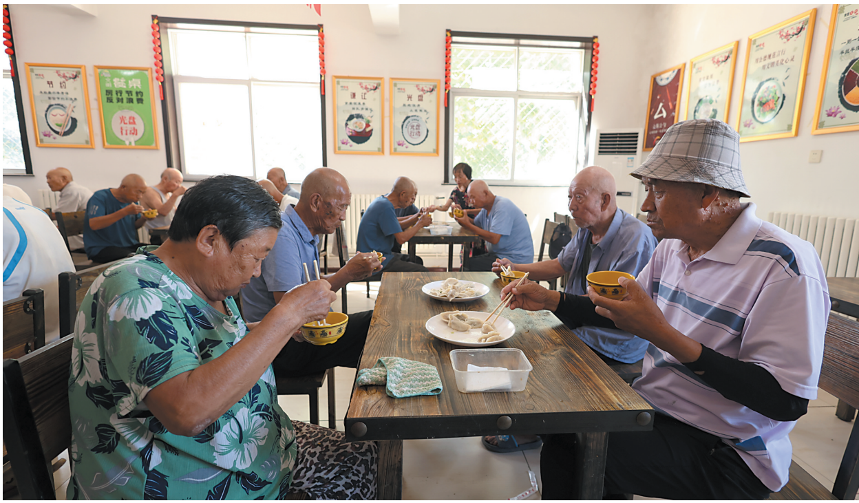
8月22日，老人们在青县金牛镇大鹤岭村孝老食堂用餐。 针对农村养老现状，河北省青县创新农村养老服务模式，大力推进“孝老食堂”建设，充分利用闲置校舍、厂房、幸福院等解决用房问题，利用社会力量、集体收入等为食堂持续运行提供保障。近年来，青县通过探索新养老模式，借助构筑“公办养老打基础、社会养老促提升、社区养老全覆盖、农村养老兜底线”的养老服务体系，打造群众身边的“养老院”。