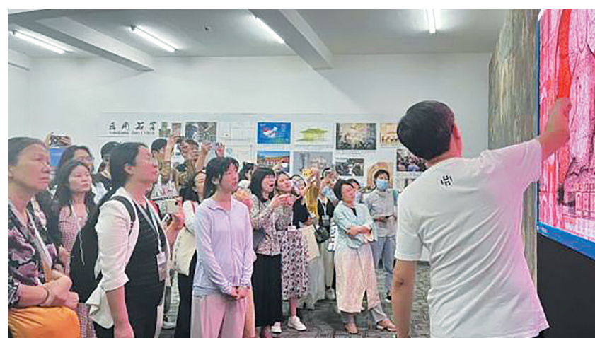
参会嘉宾在云冈考察数字人文与智慧数据融合成果