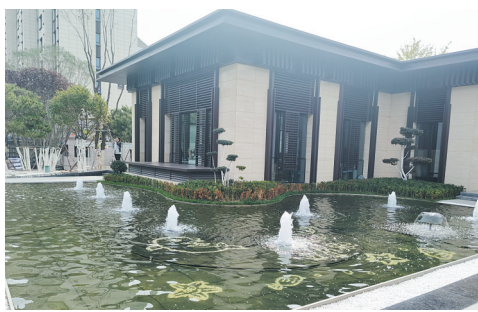
庭院深深流水潺潺