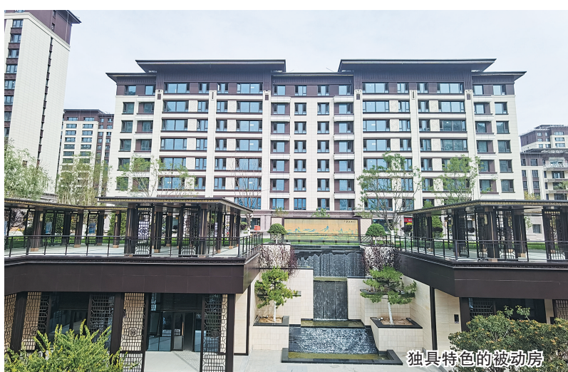
独具特色的被动房