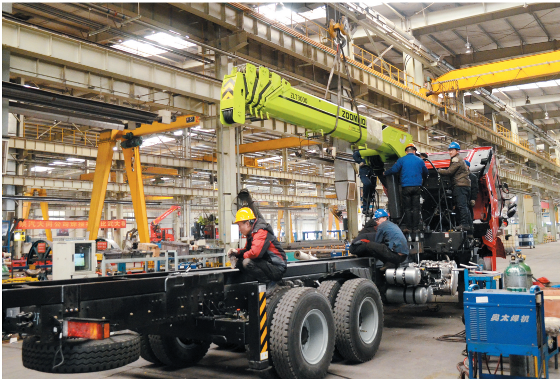
陕汽大同专用汽车有限公司不断加大新产品开发力度,提升市场竞争力。近日,该公司成功开发出新型陕汽德龙随车吊,该车型具备公告完善、动力选装丰富、改装便利、安全可靠等四大优势,可满足徐工、三一、中联重科等各品牌的随车吊配套改装。图为工人们正在对新产品进行组装。