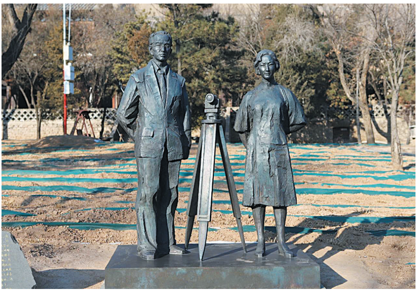
云冈石窟景区内梁思成与林徽因塑像