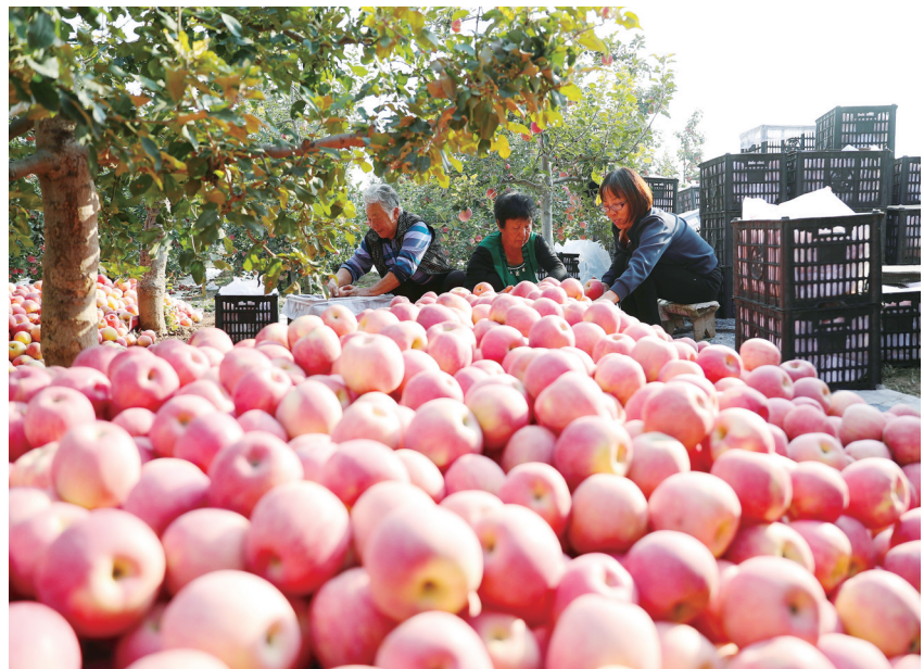
10月26日，河北顺平县南神南村果农在果园分拣采摘的苹果。眼下，在地处太行山东麓的河北省顺平县，6.6万亩苹果迎来成熟期，果农在果园忙着采摘、分拣、装运，供应市场。近年来，顺平县打造“尧乡优鲜”特色鲜果品牌，依托河北农业大学专家团队技术支持，推广矮化密植、水肥一体、生物防控等技术，实现苹果生产标准化管理，促进鲜果产业提质增效。