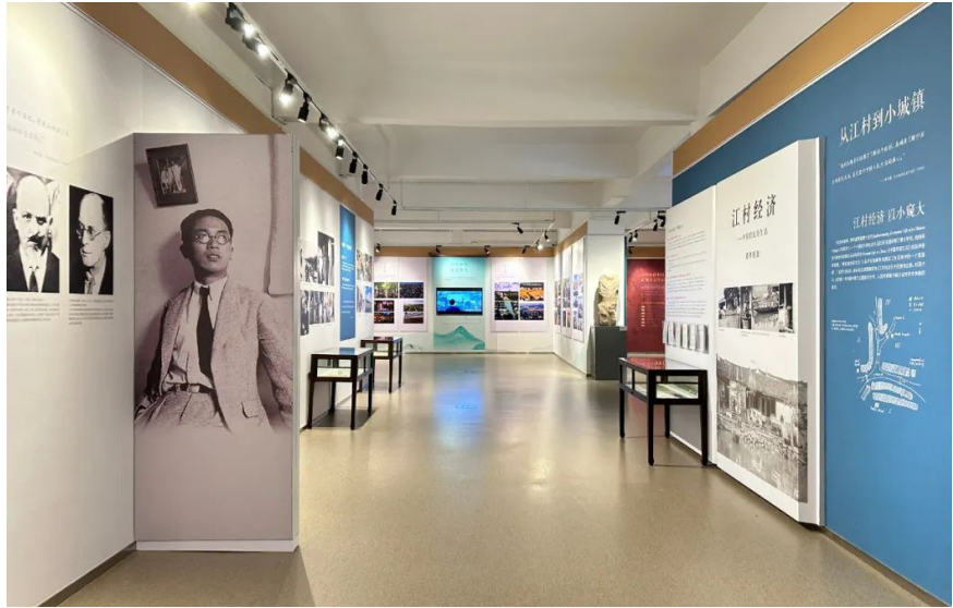
展览的第二单元“书斋与田野”