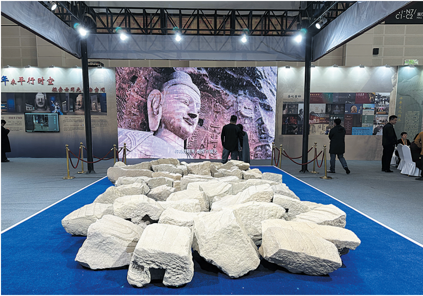
20窟西立佛残块修复件