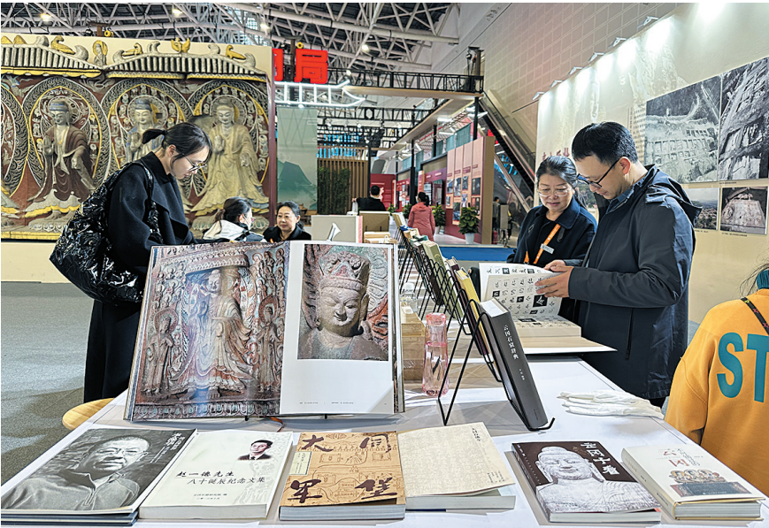
游客在浏览云冈石窟系列图书

云冈人集体智慧的结晶。纵览整个展厅，主要分为四个部分，一是保护成果展示区，集中展示云冈研究院在文物保护方面取得的工作业绩；二是“云冈学”科研成果展示区，突出展示云冈研究院在科研立项的发展战略下，“云冈学”建设取得的阶段性成果；三是文旅