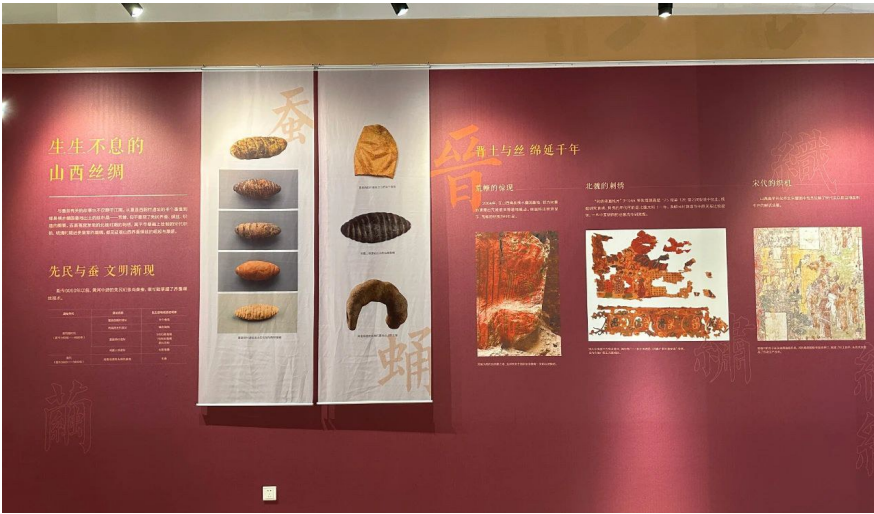
“生生不息的山西丝绢”模块的内容

美美与共 天下大同——费孝通的治学经世与家国情怀”展览是云冈和吴江两地合作的文化交流的活动之一。也是继云冈研究院“芥子须弥”特展在苏州湾博物馆成功举办之后的一次文化走亲。本次展览主题为费孝通在1990年提出的“美美与共，天下大同”，