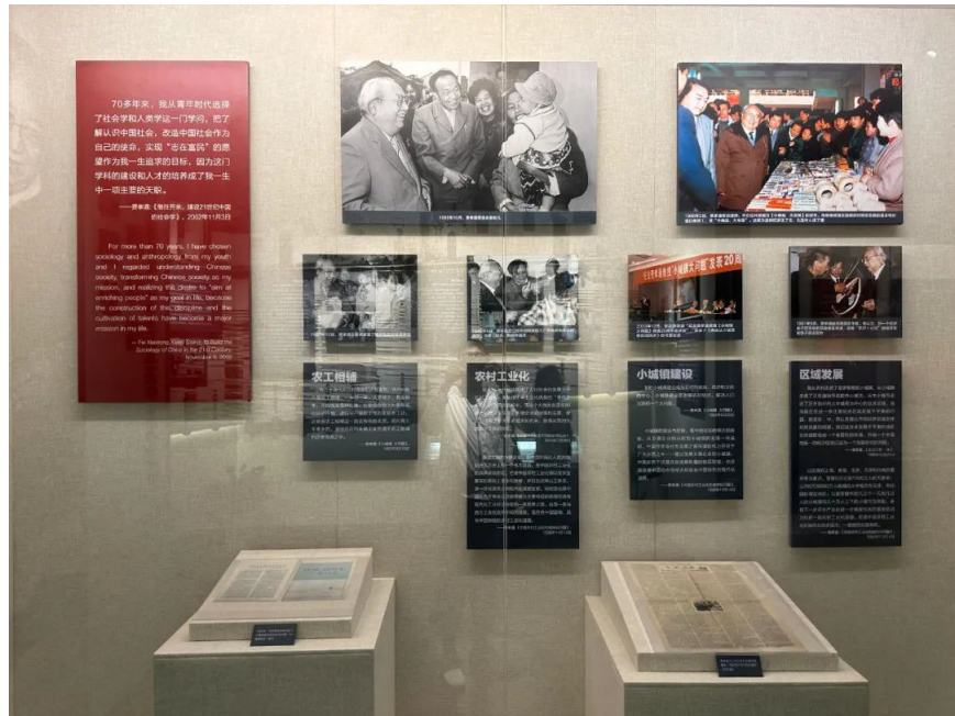
费孝通江村纪念馆（江村文化园）基本陈列中关于费孝通的展览内容

在该单元接近尾声的部分是本次展览主题“美美与共 天下大同”的深入解读和剖析，最后用费孝通于1994年在接受菲律宾拉蒙·麦格赛赛“社会领袖”奖上的发言收尾。值得一提的是，在展