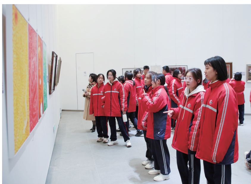
图为市一职中在校学生参观书画展作品。

本次展览共分“一职业”和“匠心梦”两个板块,其中“一职业”中的作品是校友优秀作品,“匠心梦”中的作品是在职教师、在校学生优秀作品,分别位于市美术馆第一、第六展厅。展出作品包括绘画、书法、摄影、雕塑、剪纸、手工设计等,吸引了众多观展者驻足欣赏、交流讨论。精彩的作品、多样的展示,不仅表达了校友对母校的深情厚谊,而且抒发了全校师生对母校的美好祝福。