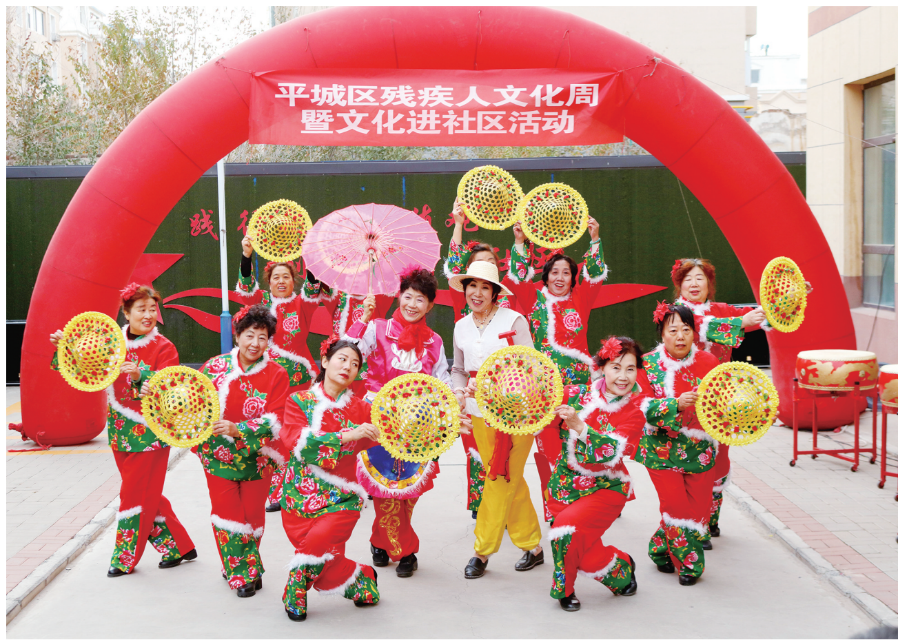
为满足残疾人多层次、多样化精神文化需求,11月15日,平城区振华街道新世纪社区组织开展“奋进新征程、逐梦新时代”残疾人文化周暨文化进社区活动...