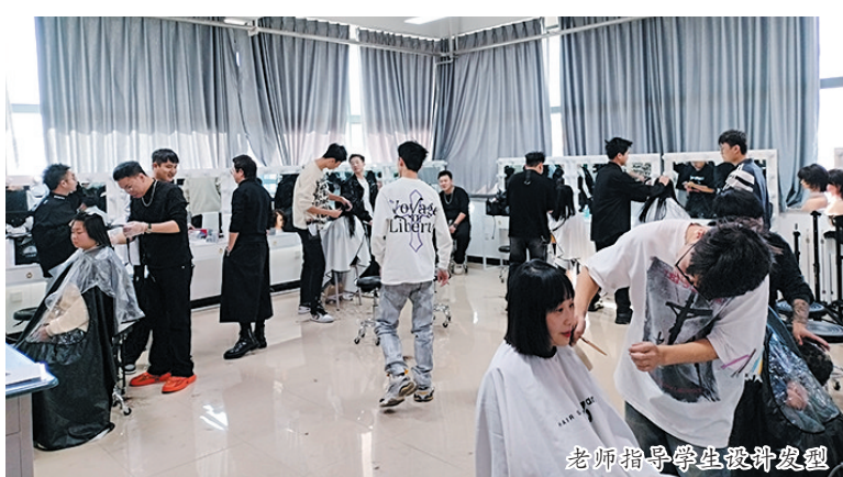
老师指导学生进行美发