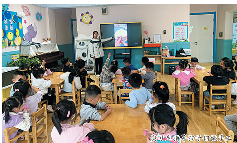
实习生指导孩子们做手工

美发与形象设计专业教学实践性强,要求学生具备较强的实操能力。今年9月,大同市财会学校为进一步强化专业建设,主动联合大同市平城区美发美妆协会、大同市三人行发型设计中心,共同打造“美发与形象设计订单班”,共招生40余名。该校负责人表示,大同市财会学校在充分发挥职业学校资源优势的基础上,以市场为导向,开创学校与企业“优势互补、资源共享、互惠互利、共同发展”的双赢局面,努力培养专业技术扎实、对接市场需求的美发从业人才。