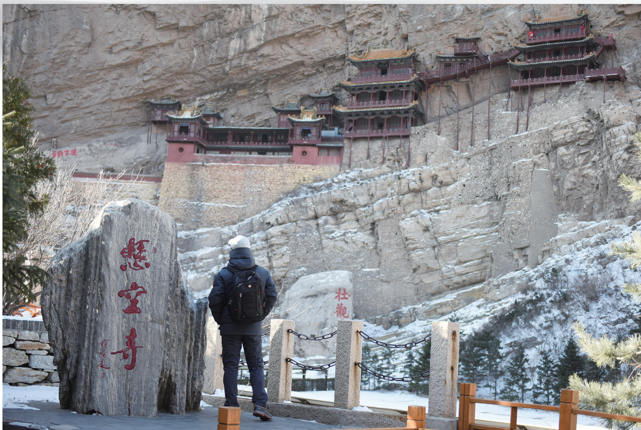
游客在悬空寺参观游览。

岩峦叠嶂，诡怪难测。冬日的恒山素朴古拙，显现出一种独特的低调，苍凉中感受最多的是厚重和宁静。沿着台阶一路而上，断崖层叠、壁立千仞，奇石怪石、各呈异状，形成独有的“版画式”山貌。恒山的自然景观以奇峰异石为特色，令人叹为观止。一路攀登中，看到数不尽的怪石林立，形态各异、别具一格。有的石峰高耸入云，宛如巨人屹立山间；有的石壁陡峭峻拔，让人心生敬畏；还有的石头呈现出诸多奇特形状，犹如自然艺术品。无论是仰望高处的宏伟景象，还是近距离触摸奇