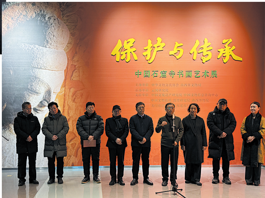
石窟寺艺术展开幕式现场

其中已故文博老前辈谢辰生先生98岁高龄时书写的“传承”二字，道出了历代文博人的初心与坚守，也表达了主办方对无数文博前辈的致