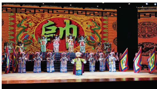
“曲起平城，韵动云中”全市专业艺术团精品剧目展演